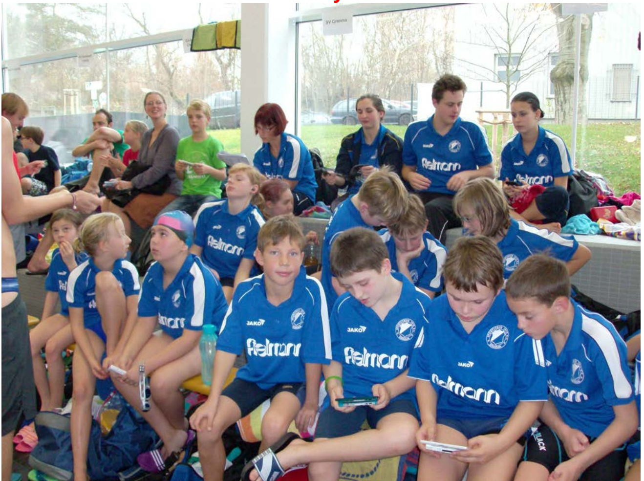
Unser erfolgreiches Team

Wir gratulieren allen Aktiven recht herzlich zu den erreichten Ergebnissen und wünschen viel Erfolg beim 18. Sparkassencup in eigener Schwimmhalle !